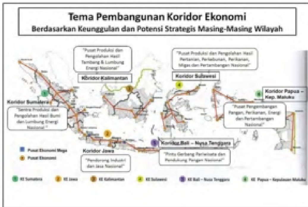
Gambar 10.1 Tema Pembangunan Koridor Ekonomi

Masterplan Percepatan dan Perluasan Pembangunan Ekonomi Indonesia (MP3EI) 2011-2025 dilaksanakan untuk mempercepat dan memperkuat pembangunan ekonomi sesuai dengan keunggulan dan potensi strategis wilayah dalam enam koridor (Gambar 10.1). Percepatan dan perluasan pembangunan dilakukan melalui pengembangan delapan program utama yang terdiri atas 22 kegiatan ekonomi utama (Gambar 9.2 dan 9.3). Strategi pelaksanaan MP3EI adalah dengan mengintegrasikan tiga elemen utama, yaitu (1) mengembangkan potensi ekonomi wilayah di Koridor Ekonomi (KE) Sumatera, KE Jawa, KE Kalimantan, KE Sulawesi, KE Bali–Nusa Tenggara, dan KE Papua–Kepulauan Maluku; (2) memperkuat konektivitas nasional yang terintegrasi secara lokal dan terhubung secara global ( locally integrated, globally connected ); (3) memperkuat kemampuan sumber daya manusia (SDM) dan iptek nasional untuk mendukung pengembangan program utama di setiap koridor ekonomi. Sesuai dengan yang dicanangkan, ketiga strategi utama itu dilihat dari perspektif penelitian perguruan tinggi sesuai dengan cabang keilmuan di setiap perguruan tinggi tersebut, dan sumber daya alam (SDA) yang berada dalam setiap koridor terkait.