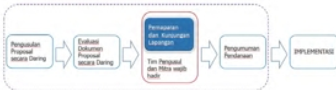
Gambar 27.2 Skema usulan Iptek bagi Desa Mitra (IbDM)

Seleksi dan evaluasi proposal Program IbW dilakukan dalam tiga tahapan, yaitu evaluasi dokumen proposal secara daring, pembahasan (paparan) untuk proposal yang dinyatakan lulus dalam evaluasi dokumen secara daring, dan kunjungan lapangan ( site visit ). Borang evaluasi dokumen proposal secara daring, pemaparan dan kunjungan lapangan sebagaimana terlihat pada Lampiran 27.4, Lampiran 27.5 dan Lampiran 27.6. Tahapan proses seleksi dapat diilustrasikan seperti pada Gambar 27.2.